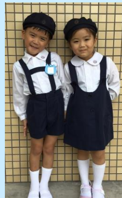
中間服・ベレー帽子