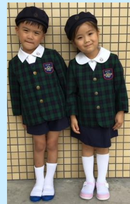
冬服・ベレー帽子