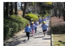
わっしょい走ろう