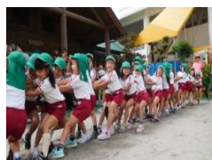
十五夜綱引き大会