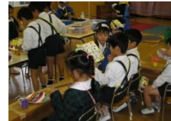
お寿司屋さんごっこ