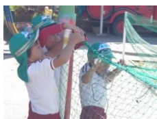
パトロール隊(係活動) 砂場のネット張り・片付け 野菜や花の水かけ

一人一人の個性を伸ばして、豊かな心情や 主体性、創造性 を育て、 心身共に健全 で有為な人間の基礎を培います。