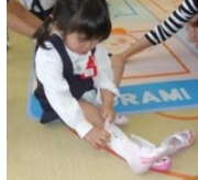
トイレ・衣服の着脱