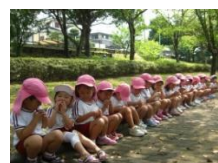
ブルーベリーロード でのおやつ

園に隣接しているブルーベリーロードでは、散歩をしたり、お弁当やおやつを食べたり、体力づくりの一環として「わっしょい走ろう」に取り組んだりして季節の変化を感じながら自然や小動物にふれ、楽しんでいます。地域の人々との交流も含め、子どもたちにとってとても親しみのある場所となっています。