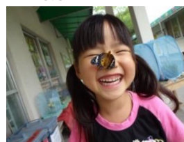
チョウチョさん かわいいね♪