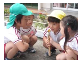
蜜を吸っているね☆