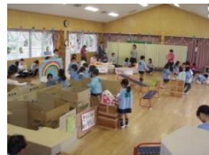
ゲームセンターごっこ