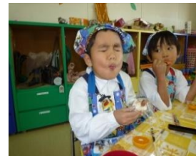
うめぼし おにぎりパーティー