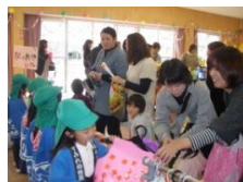
いろいろな模倣遊び (お店屋さんごっこ)