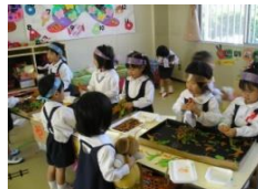
焼きそば屋さんごっこ