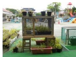
ツマグロヒョウモンチョウの飼育ケース

すみれ幼稚園には、四季折々の草花がたくさん！そこに集まってくるちょうちょ、バッタ等は子どもたちにとっては友達みたいなもの。また、クラスで飼育するカブトムシやチョウの幼虫の世話も意欲的に行います。子どもたちは周囲の様々な生き物に好奇や探求の目を向け、生命の不思議さに驚いたり、その変化を発見し、喜んだりしながら 生命の神秘や大切さ を感じているようです。