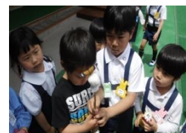
さなぎからチョウに変身！