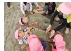
砂場遊び・どろんこ遊び