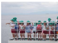
フェリー乗船・桜島恐竜公園