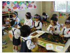
焼きそば屋さんごっこ