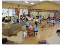
ゲームセンターごっこ