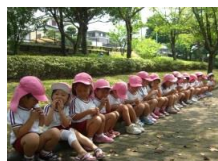
ブルーベリーロードでのおやつ

園に隣接しているブルーベリーロードでは、散歩をしたり、お弁当やおやつを食べたり、体カづくりの一環として「わっしょい走ろう」に取り組んだりして季節の変化を感じながら自然や小動物にふれ、楽しんでいます。地域の人たちとの交流も含め、子どもたちにとってとても親しみのある場所となっています。