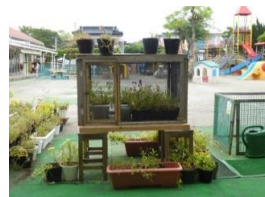
ツマグロヒョウモンチョウの飼育ケース

すみれ幼稚園には、四季折々の草花がたくさん！ そこに集まってくるちょうちよ、バッタ等は子どもたち にとっては友達みたいなもの。また、クラスで飼育する カブトムシやチョウの幼虫の世話も意欲的に行います。 子どもたちは周囲の様々な生き物に好奇や探求の目 を向け、生命の不思議さに驚いたり、その変化を発見 し、喜んだりしながら 生命の神秘や大切さ を感じている ようです。