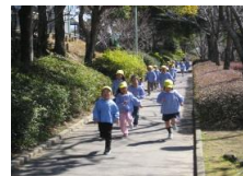
わっしょい走ろう