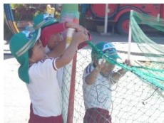
パトロール隊(係活動) 砂場のネット張り・片付け 野菜や花の水かけ

一人一人の個性を伸ばして、豊かな心情や 主体性、創造性 を育て、 心身共に健全 で有為な人間の基礎を培います。