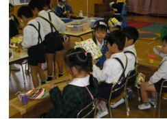
お寿司屋さんごっこ