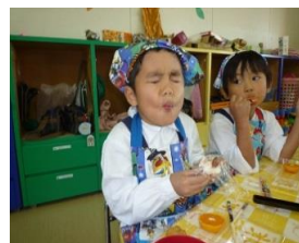
うめまし おにぎりパーティー