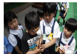
さなぎからチョウに変身！