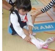
トイレ・衣服の着脱