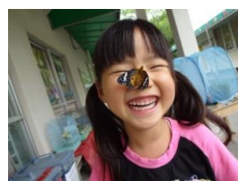
チョウチョさんかわいいね♪