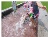
ふれあいスポーツランド