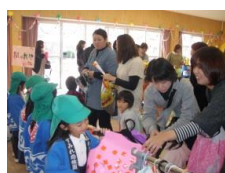
いろいろな模倣遊び (お店屋さんごっこ)