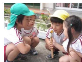
蜜を吸っているね☆